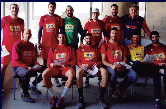
El Palacio de los Deportes de Huesca acogió la reunión informativa con los profesionales del Club BADA Huesca, de los más participativos siempre con la A.J.BM.