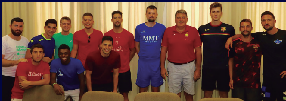
Alicante y el C.D. AGUSTINOS fueron una de las primeras visitas del gerente de la A.J.BM. Los alicantinos del Colegio "San Agustín" cursan su segunda temporada en la División de Honor Plata.