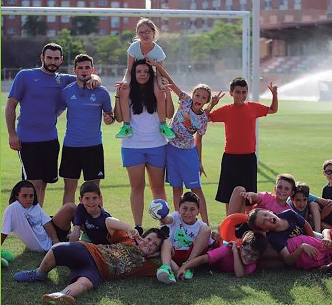
El campo de Fútbol de la Universidad Laboral de Zamora también sirvió para la preparación física.