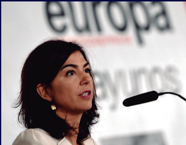
María José Rienda Contreras. PRESIDENTA DEL CONSEJO SUPERIOR DE DEPORTES.