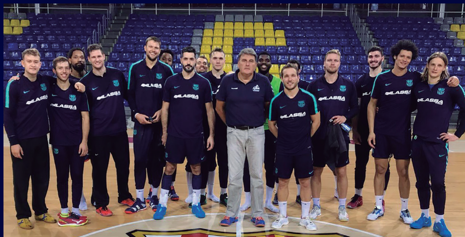
El Palau Blaugrana, escenario histórico de tantos éxitos del Balonmano español, sede de la reunión con los profesionales blaugranas