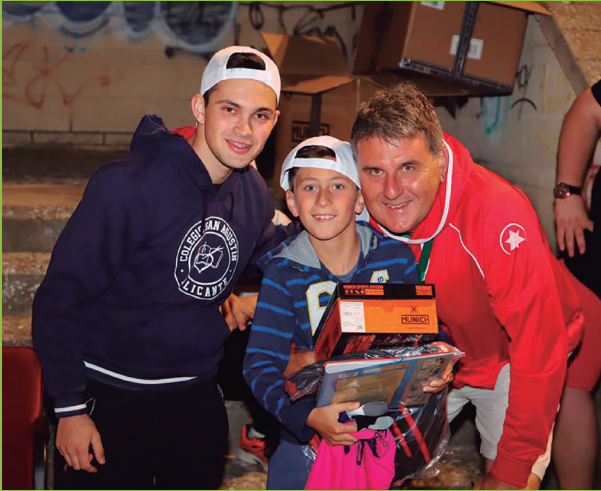
Los benjamines disfrutaron ya en la primera noche con la entrega del material