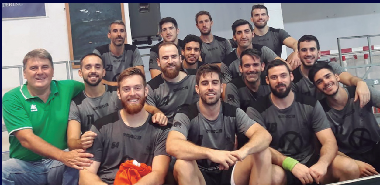
Abajo. En Puente Genil, la plantilla casi al completo no faltó a la cita con la ASOCIACIÓN DE JUGADORES.